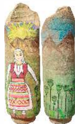
1. Марија Попова 8 одд. ОПУ „Страшо Пинџур“ с.Дреново