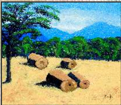
10. Каја Наумовска 3-В одд. ОУ „Даме Груев“ Битола