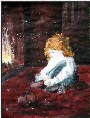
7. Марија Манева 9 одд., ООУ „Гоце Делчев“ Кавадарци