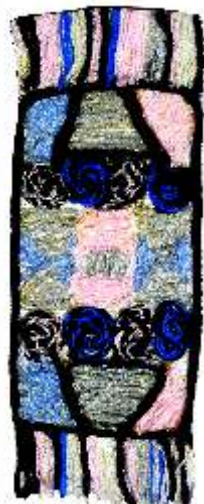
26. Мирслав Јовановски 9-1 одд. ОУ „7. Марси“ с.Челопек – о.Брвеница