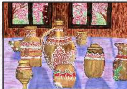
30. Тања Ајтова 8 одд. ООУ „Тошо Велков-Пепето“ Кавадарци