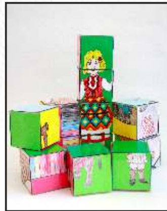
36. Даниел Каракоевски 1 одд. Теона Деловска 1 одд. Ксенија Василевска 4 одд. Филип Митревски 4 одд. Валерија Василевска 5 одд. Евгенија Матовска 5 одд. ООУ „Славко Лумбарковски“ Новаци ПУ с. Гермијан