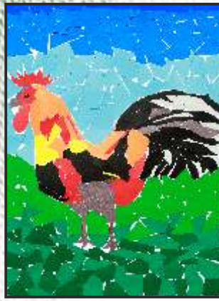
14. Наталија Михаилова 9-3 одд. ООУ „Раде Кратовче“ Кочани