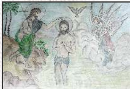
27. Георгина Миланоска 8-2 одд. ООУ „Св.Климент Охридски“ Македонски Брод