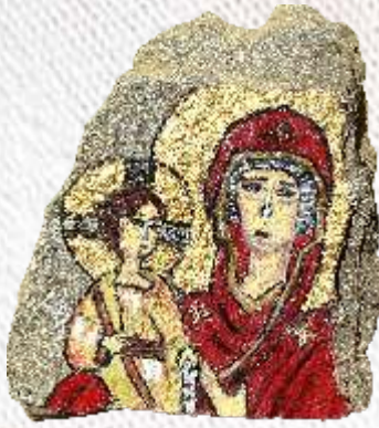
2. Ангела Петровска 3-В одд. ОУ „Даме Груев“ Битола