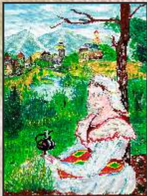
5. Ненад Стојанов 9 одд. ООУ „Гоце Делчев“ Кавадарци